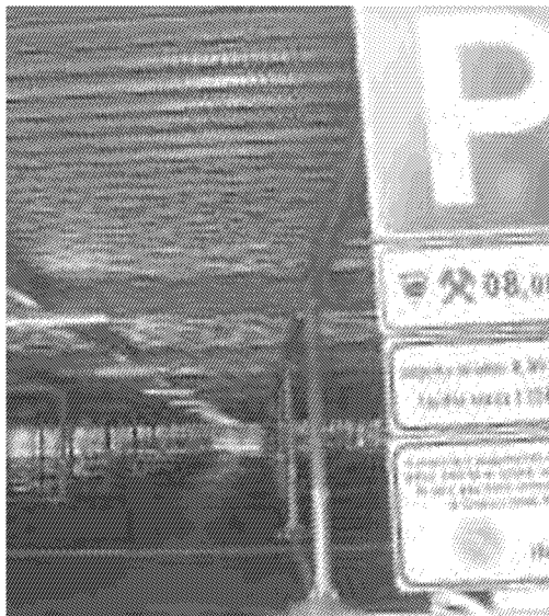
Ancora novità per la sosta in centro città

«Rimaniamo fermamente convinti che il confronto, ladove ogni soggetto esponga le proprie posizioni - conclude Confcommercio Valdera -, nel rispetto dei reciproci ruoli, sia l'unica strada percorribile per arrivare a decisioni le più condivise possibili. Nell'interesse dell'intera collettività».